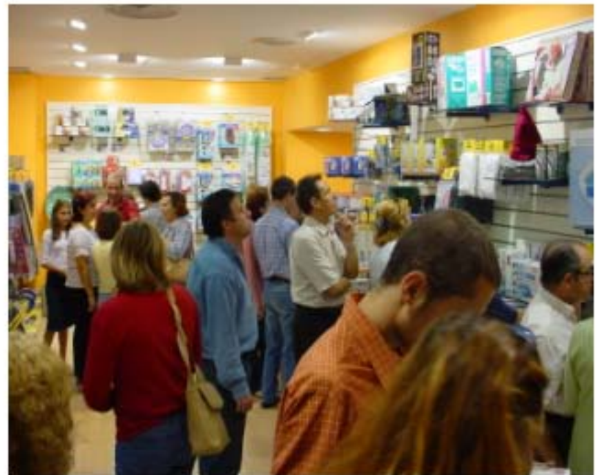
Negoziò di Madrid